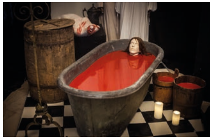
Alžbeta Bathory a jej legendárny krvavý kúpeľ