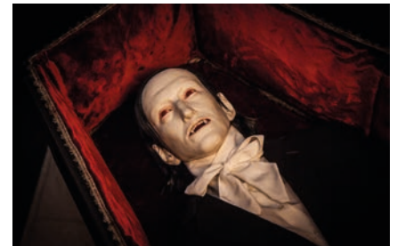
Gróf Dracula zavíta do Čachtíc

zvedia podrobnosti, kto kedysi dávno naháňal strach našim predkom. Priestory sa na túto akciu kompletne zatemnajú, aby sme pre návštevníkov navodili pocit úzkosti a strachu aj počas snečných augustových a septembrových dní. Doplňkovou aktivitou počas celého leta bude aj výstava hračiek, s ktorými sa hrávala generácia tzv. Husákových detí. Výstava „ Hračky Husákových detí “ bude v určitých vstupoch obohatená aj o možnosť vyskúšania si niektorých exponátov. Návštevník uvidí niekoľko zberateľsky vzácných hračiek, ktoré časom získali na hodnotu, predovšetkým kvalitným dielenským spracovaním. Každé pla-